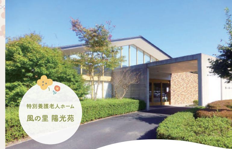
特別養護老人ホーム 風の里 陽光苑