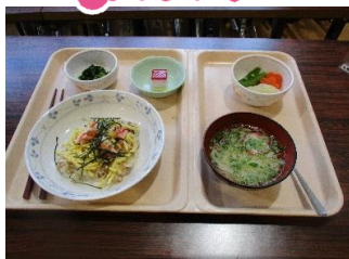
ちらし寿司、皆さん好評でした。