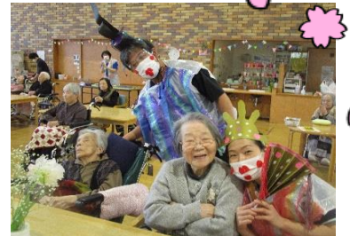
皆さんの沢山の笑顔がみられました。