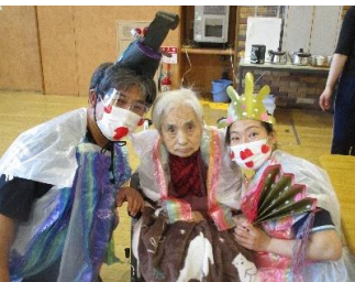
お内裏様とお雛様と一緒にハイチーズ